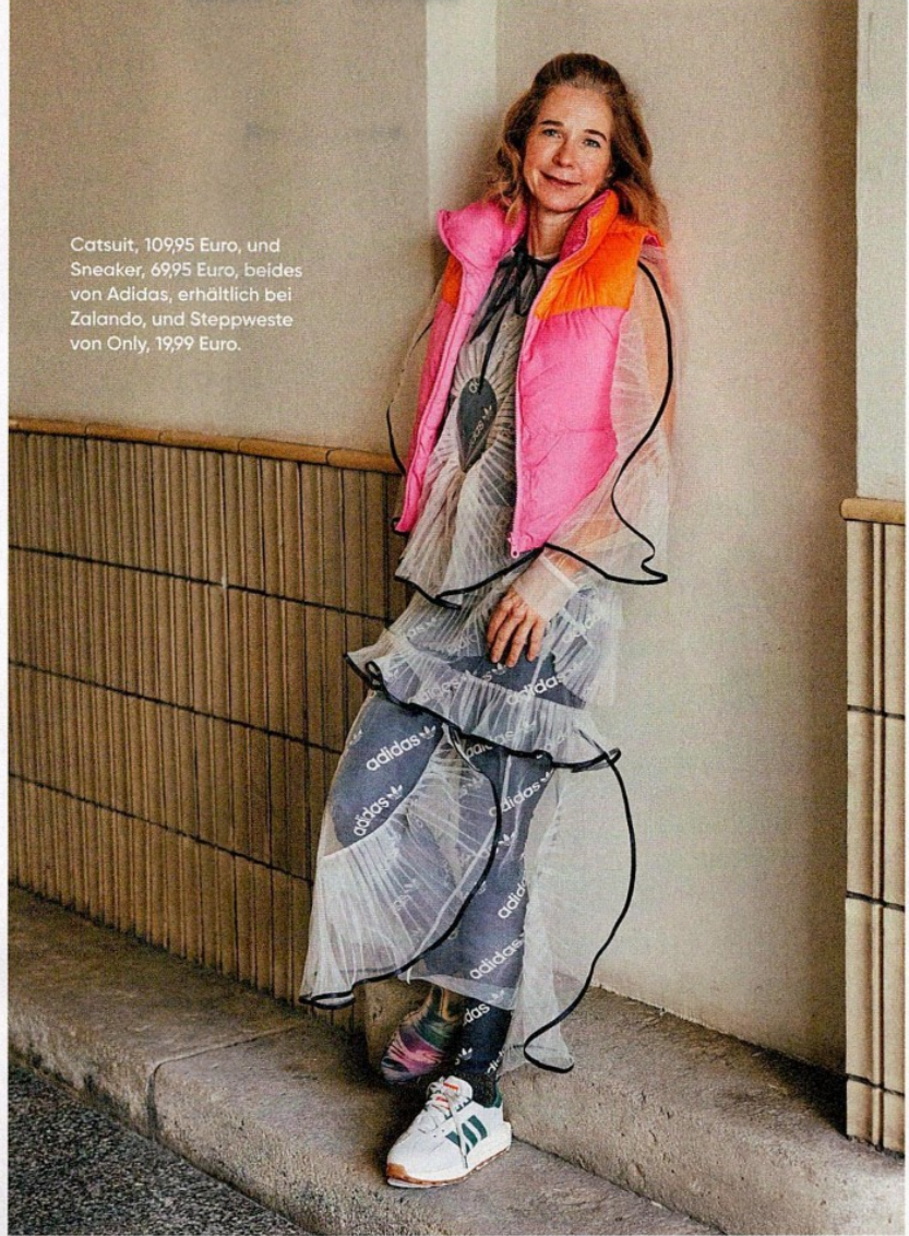
Catsuit, 109,95 Euro, und Sneaker, 69,95 Euro, beides von Adidas, erhältlich bei Zalando, und Steppweste von Only, 19,99 Euro.

Guter Move! Down-Dressing im allerbesten Sinn ist das Stichwort für diesen aufregenden Look, der wieder einmal zeigt, welch großes Potenzial im modischen Stilbruch liegt. Unter dem Keypiece trägt unsere Leserin ein sportliches Catsuit mit Logoprint, das dem extravaganten Kleid Coolness verleiht. Eine Steppweste in leuchtenden Farben bringt Frühlingsfrische ins Outfit, Sneaker sorgen für ideale Bodenhaftung.