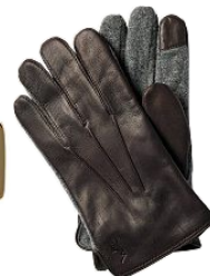
Herrenhandschuhe von Polo Ralph Lauren , 99,99 €, peek-cloppenburg.at