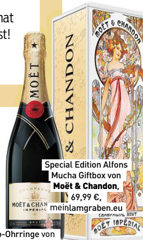
Special Edition Alfons Mucha Giftbox von Moët & Chandon , 69,99 €, meinlamgraben.eu