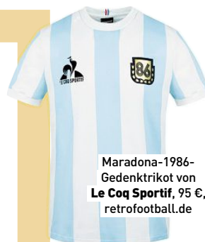
Maradona-1986-Gedenktrikot von Le Coq Sportif , 95 €, retrofootball.de