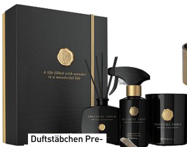
Duftstäbchen Precious Amber Gift Set von Rituals , 85,90 €, rituals.com