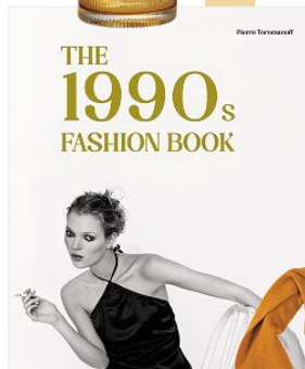
„The 1990s Fashion Book“ von Pierre Toromanoff , 61 €, thalia.at