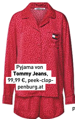
Pyjama von Tommy Jeans , 99,99 €, peek-cloppenburg.at