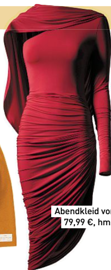
Abendkleid von H&M , 79,99 €, hm.com