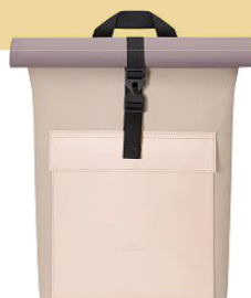
Rucksack von Ucon Acrobatics , 99,99 €, ucon-acrobatics.com