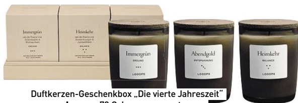
Duftkerzen-Geschenkbbox „Die vierte Jahreszeit“ von Looops , 70 €, loopsmoments.com