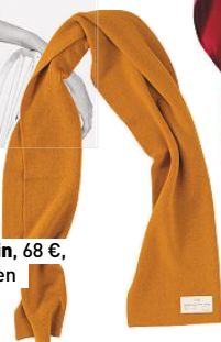
Schal von Glein , 68 €, glein.wien