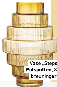
Vase „Steps“ von Polspotten , 84,99 €, breuninger.com