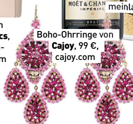
Boho-Ohrringe von Cajoy , 99 €, cajoy.com