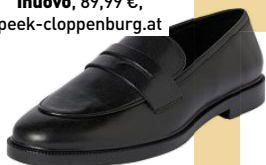
Damenslipper von Inuovo , 89,99 €, peek-cloppenburg.at